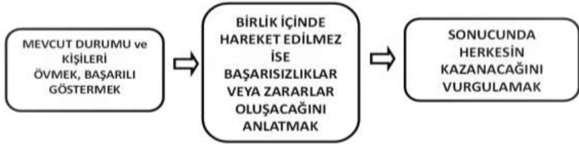
řekil.1: Davranıřların Hareket řeması

Yukarıdaki řemaya gre hareketler řyle gerekleřmiřtir.