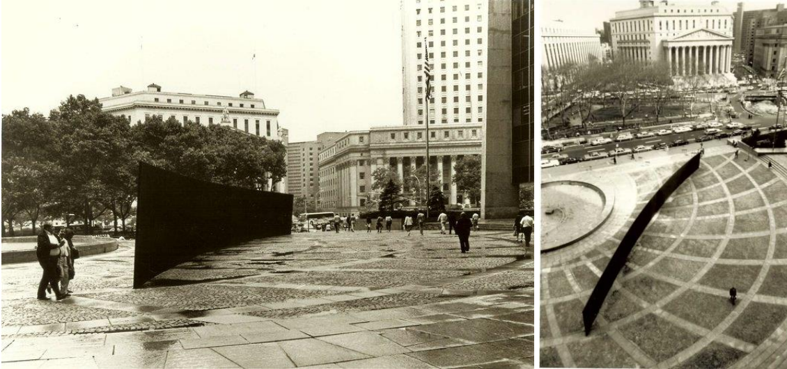
Görsel 1: Richard Serra, "Tilted Arc" Çelik, 365.7x3657.6x30.45 cm. 1981

Teknik, biçim, konu yanı sıra örneđin bir heykel özellikle nesne varlıđıyla konum belirleyici, yön gösterici, Serra'nın işinde olduđu gibi yön deđiřtirici özellikleriyle etkileřim oluşturabilir (Görsel 1). Heykeli izlemek, onun belirlediđi alan içinde olmak ya da kořullarına uyum sađlamak izleyici açısından bir tür etkileřimdir. Ancak bu arařtırmada seyircinin yapıtın tamamlayıcılıđı ile etkileřim ele alındıđı için detaylandırılmamıřtır.