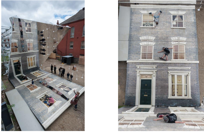
Görsel 3: Leandro Erlich, “Dalston House”

En önemli örneklerinden bir diğeri Yoko Ono'nun 1965 yılında gerçekleştirdiği “Cut Piece”tir. Performans sanatının öncülerinden sayılan Ono, kendi bedenini sanat eserine dönüştüren bir sanatçıdır. Sanat, her şeyden önce sanatçının kendi bedeniyle ifade edilebilen bir yoldur onun için ve sergilenebilen bir hal almaktadır (Antmen, 2008).