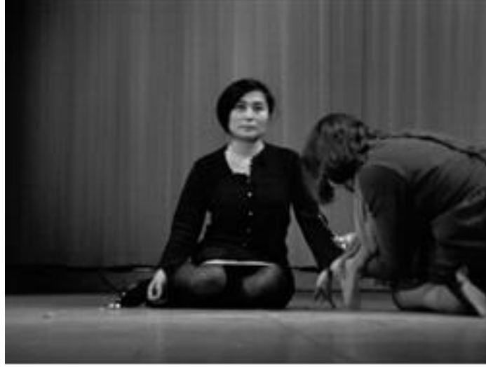
G¼rsel 4: Yoko Ono, Cut Piece (still), 1964

İlk bařta siyah bir kıyafetle sahnede oturan Ono, seyircisinin m¼dahaleleriyle giderek giyimsiz kalmıř, her bir m¼dahaleyle yeni g¼r¼nt¼ler ve sorgulamaları g¼ndeme getirmiřtir (G¼rsel 4).