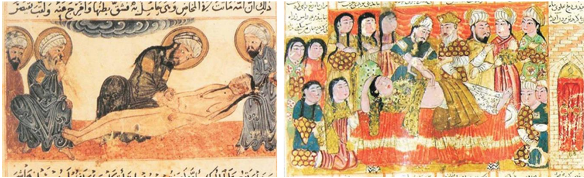
Resim 2. Biruni, Al-Athar «Sezaryenle Doğum Sahnesi» Resim 3. Firdevsi, Şehnamesi «Sezaryenle Doğum Sahnesi» ( URL 1 )

Ayrıca Firdevsi'nin Şehnamesi 'nde de sezaryen doğumla ( Resim 2 ) ilgili sahnelere rastlanılmaktadır. Firdevsi'nin Şehname 'si yanında Biruni'nin Al-Athar adlı yapıtında da sezaryenle doğum sahnesinin ( Resim 3 ) ayrıca annenin karnında ölen bebeğin doktor tarafından alınmasının tasvir edildiği görülmektedir. ( URL 1 )