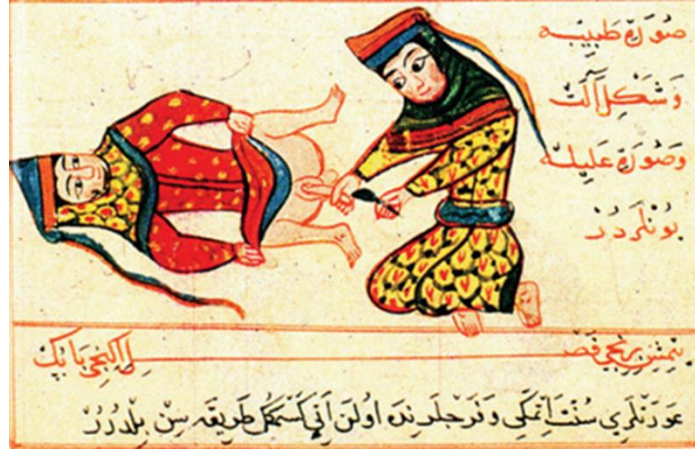
Resim 1. Süheyl Ünver, Şerefeddin Sabuncuoğlu Cerrahiye-i İlhaniyye 'Kadın Hastalığı Tedavi Yöntemi', İstanbul Tıp Tarihi Enstitüsü Nüshası Minyatürleri, 1909, s. 773.)

Erken dönem minyatür örneklerine bakıldığında, Cerrahiye-i İlhaniyye 'nin 2 nüshaları içinde kadınların tedavilerine yönelik sahnelerin betimlendiği görülmektedir.(Gümüşer, 2013: 20-21) Doktor ya da ebe olduğu düşünülen kadın ( Resim 1 ), olasılıkla kadının rahminden uzanan bir parçayı tedavi etmektedir. (Ünver, 1939: 48-50)