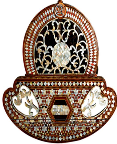
Resim 7. Şehzade Beşiği (TSM, nr. 8/912) (İsmail Ediz, Büyük İstanbul Tarihi, C.4, İstanbul, s. 474)

kadın kocasını karşılamak üzere giydirilir. Çocuğu eline verilen baba, onu kibleye doğru tutarak sağ kulağına ezan okur ve kelime-i şehadet getirir; sol kulağına besmele ile bebeğin adını üç kez söyler. Üçüncü gününde ise lohusa kadın eş dost ve akrabalarıyla misafirlerini ağırlar. Yedi gün boyunca gösterişli yatağında sadece şerbet içerek dinlenir. Yedinci gün yatak kaldırılır, sedef veya gümüş kakmalı ahşap oymalı beşik (Resim 7) getirilir ve bebek ona yatırılır. Bu gün bebek mevlidi okunur. Mevlitten sonra dansçı kızlar dans eder. Yemekler yenir, eğlenceler yedi gün boyunca devam eder. (Davis, 2006: 48-50)