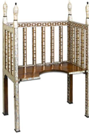
Resim 6. Doğum İskemlesi (TSM, nr,12/175) (İsmail Ediz, Büyük İstanbul Tarihi , C.4, İstanbul, s. 472)

gerçekleştirdiği, bazen şarkıcılar, rakkaselerin doğum sancısı çeken anne adayını oyalamak üzere içeri alınır. Doğum zor bir olaydan çok kutlama gibi yaşanır. Bebek doğar doğmaz sütannenin kucağına verilir. Haberi saraya kızlar duyururdu. Sarayın her dairesi bebek erkeğe beş, kıza üç koç, kurban edilirdi. Ayrıca erkek için yedi pare kız için üç pare top atılır bu atışlar her namaz vakti tekrarlanmak üzere gerçekleştirilirdi. Valide sultan ve sadrazam kabuller düzenler, bebeğe lohusaya ve harem ileri gelen kadınlara kıymetli hediyeler verilir. (Özbilgen 2004: 524). Değerli taşlarla süslü nadide beşikler Şehzade Beşiği ( Resim 7 ) ve ipek yorganlar saraylı bebekler için hazırlanırdı. Harem ışıklı ve renk cümbüşüne dönüşür, bir hafta süren doğum kutlamaları boyunca haremde hareketlilik yaşanır. İçeride olduğu gibi dış mekânlar da fenerler, lambalar, meşaleler ile aydınlatılırdı.(Aksoy Croutier, 2009: 108-109)