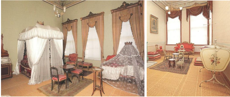
Resim 5. Veladet Odası (Cengiz Göncü, Osmanlı'da Harem ve Cariyelik , İstanbul, 2015, s.251)

Doğumun ardından Sadrazam ve valide sultanın düzenledikleri beşik alayları, veladeti hümayunun en önemli merasimlerindenidir. (Resim 5) Bu merasimler muhtemelen 18. Yüzyılın sonundan itibaren gelenekselleşmiştir. Sadrazam beşik alayı 3 için doğumun beşinci günü sadaret kethüdası tarafından törene katılacaklara davetiyeler gönderilir, belli saatte paşa kapısında bulunmaları istenirdi. Altıncı gün davetliler geldikten sonra oldukça kalabalık ve göz kamaştırıcı bir tören icra edilirdi. Valide sultanın hazırladığı beşik alayı da bir takım teşrifat kuralları çerçevesinde şaşaalı bir şekilde gerçekleştirilirdi. (Uzunçarşılı, 1998: 167-168)