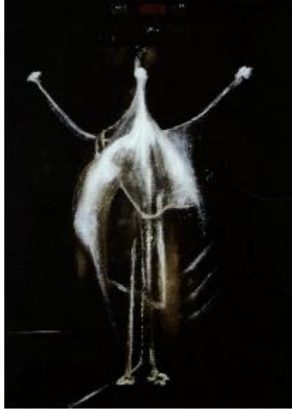
Resim 9. Bacon, 1933, “Çarmıha Gerilme”, Tuval Üzerine Yağlı Boya, (60.5 x 47 cm.) .

Bacon farklı yıllarda çeşitli “Çarmıha Gerilme” temalı resimler yapmıştır ve bunların ilki 1933 tarihli (Resim 9).