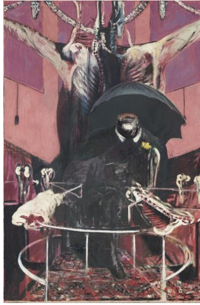
Resim 1. Francis Bacon, 1946, Tuval Üzerine Yağlı Boya, Pastel Tekniği, (197.8x132.1 cm.).

“Bacon için resim, sinir sisteminin iki boyutlu yüzeye aktarıldığı, soyutla figüratif arasındaki ince dengede belirmektedir. Sanatçı belirli bir imge, fotoğraf ya da modelden yola çıkarak bunları tümüyle çarpıtıp, ortaya daha şiddetli ve gerçek olanı çıkartmıştır. Çok soğuk, yalın ve o denli şiddet dolu iç mekanlardaki insanlar sanki intihar, ölüm ve işkence anında belgelenmiştir” (Eczacıbaşı Sanat Ansiklopedisi, 1997, s. 179).