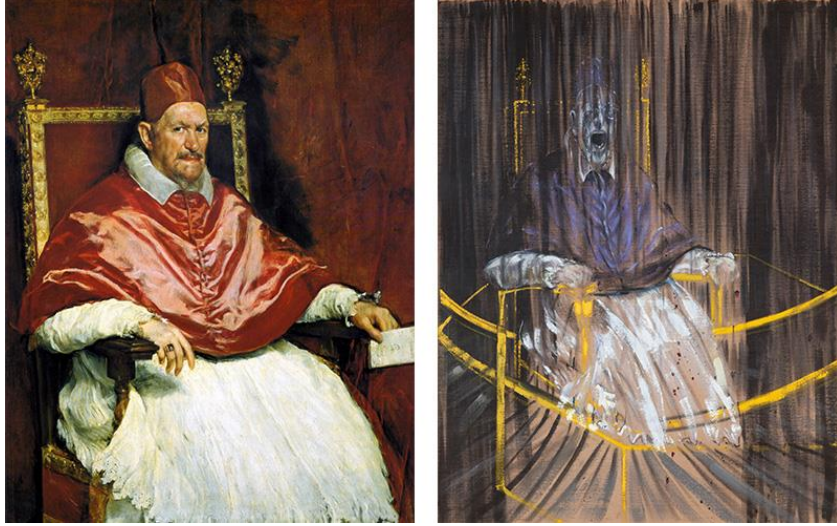
Resim 3. Diego Velázquez, Portrait of Pope Innocent X , 1650 - Francis Bacon'ın Eseri 1953 Velázquez'in Masum Papa X Portresi'nden sonra çalışan Francis Bacon , Tuval Üzerine Yağlıboya, (153cm x 118cm).

Genellikle Bacon'un eserlerinde çılglık varılabilecek en güzel yorum olacaktır. Kimi zaman figürün sahici çılgılığı, kimi zaman eserin bütününde algının sonucunda ortaya çıkan çılgılık. Ki bu çılgılık öyle güçlü, öyle gerçek, öyle etkileyici ki izleyen her bireyle bütünleşir ve çoğalır etkiye sahiptir.