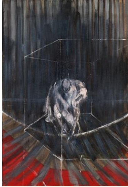
Resim 2. Bacon, 1951, “Çömelen Çıplak”, Tuval Üzerine Yağlı Boya, (196.2 x 135.2 cm.).

Bacon eserlerini, insana acı veren bu olayların çoğunun açığa vurulmasında gerçekte belli bir emek harcamadan acı çekmeyen halktan insanların fotoğraflarından yararlanarak yapmıştır. Aralarında Çömelen Çıplak Üzerine İncelemeler'in de bulunduğu pek çok tablosunda sanatçı, Muybridge'in insan ve hayvan hareketleri üzerine yaptığı bilimsel incelemeleri kapsayan bir dizi fotoğraftan yararlanmıştır. Francis Bacon'ın ürküntü veren figürlerinin böylesine güzel boya pasajlarıyla sunulması, çok daha sarsıcıdır. Halbuki kullandığı araçlar ve verdiği ileti arasında böylesine etkili bir uyumsuzluk yaratmayı, yalnız Goya başarmıştı. Bir bakıma bu ikileme dayanılarak, Bacon Sürrealist gelenekten çok Ekspresyonist geleneğe yakın bulunabilir. Öteki nedenler göz önüne alınınca da ona Moore'un yanında yer verilebilir (Lynton, 2009, s.258).