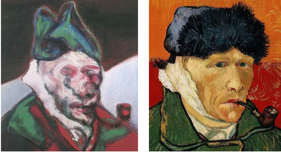
Resim 4. Francis Bacon, 1960, Tuval Üzerine Yağlı Boya, (86 x 86 cm.).

Yaklaşık 1650 yılında Velázquez'in yaptığı resmin orijinalinde papanın ağzı sıkıca kapatılmıştır. Ancak Bacon'ın 1950'lerin başından itibaren yaptığı bu tür resimlerinin çoğunda figür çılgılık atıyor ve kafese kapatılıyor. Bacon, röportajlarda "ağız ve dişlerin gerçek görünümüne her zaman çok takıntılı olduğunu" ve "her zaman Monet'in bir gün batımını resmettiği gibi ağzı boyamayı umduğunu" söylemiştir (CNN Style Websitesi, 2019).