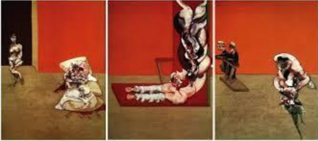
Resim 11. Bacon, 1965, “Çarmıha Gerilme”, Munich, (197.5cm x 147cm.).

“İsa’nın çarmıha gerilmesi Avrupa sanatında yüzyıllardır kullanılan bir temaydı ve Bacon bu temayı dünyevi bağlama oturtarak kurban etme ritüelleri ile ilgili çağrışımları kendini ifade etmeye yarayan bir araç gibi kullandı. Sanatçı, çarmıha gerilmeyi insan davranışlarında var olan vahşet ve şiddetin sembolü olarak görüyordu. Bu düşüncesini, kurbanı kasaplık et gibi tasvir ederek vurguluyordu” (Farthing, 2012, s.464).