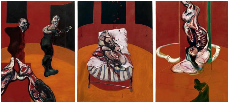
Resim 10. Bacon, 1962, “Çarmıha Gerilme Üç Etüd”, (198.1 x 144.8 cm.).