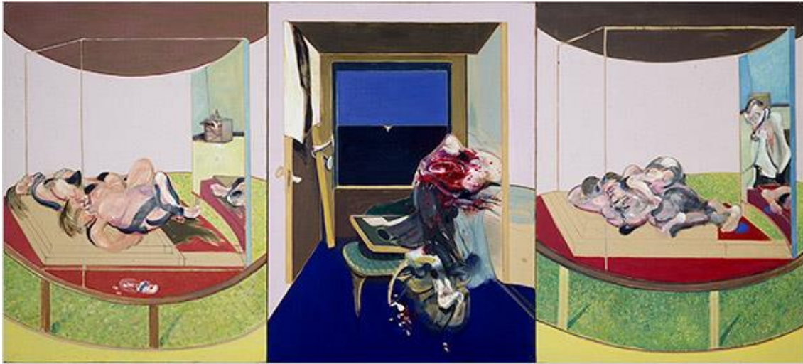
Resim 7. Bacon, 1967, Tuval Üzerine Yağlı Boya, Üç Panel Halinde: (a)198,8 x148.3 cm. (b)198,8x148cm, (c)200,3x148cm.