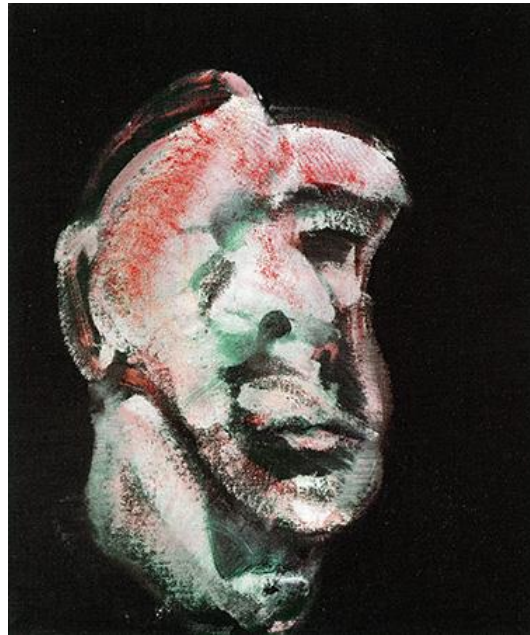
Resim 5. Bacon, 1961, Head I (Kafa I), Tuval Üzerine Yağlı Boya, (37.5 x 31 cm.).

Sanatçı resimlerini yaparken tesadüflerin oynadığı rolün önemine değinir ve anlattığı durumların pesimistliğini inkar etmez, fakat bunlardan “oyun... neşeli birer umutsuzluk”, olarak bahseder. 23 Mart 1963'te yayınlanmış Bacon'un David Sylvester'le yapmış olduğu söyleşide resimlerinde tesadüflerin önemini şu örneği vererek anlatır: “1946 yılında yaptığım resimlerden biri, kasap dükkanı gibi olan resim, tesadüfen ortaya çıktı. Bir tarlaya konan bir kuş yapmaya çalışıyordum. Bu da bir şekilde daha önce çıkmış olan üç biçimle iç içe geçmiş olmalı, ama ansızın çizdiğim çizgiler tümüyle farklı bir şeyi düşündürdü ve bu düşünceden de bu resim ortaya çıktı. Bu resmi yapmaya niyetim yoktu hiç; hiç bu şekilde olacağını düşünmemiştim. Sanki peşpeşe kazalar üstüste bindi” (Harrison ve Wood, 2011, s.676).