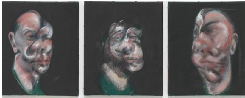
Resim 6. Bacon, 1962, “Üç Kafa” Çalışması, Tuval Üzerine Yağlı Boya, Her Panel: (35,9 x 30,8 cm.).

gün onu biraz daha ileri götürmeye çalışıp daha keskin, daha yakın bir şey yapmaya çalıştım ve imgeyi tümüyle kaybettim. Çünkü bu imge figüratif resim denen şeyle soyutlama arasındaki bir tür ip yürüyüşü gibi. Dosdoğru soyutlamadan çıkacak ama aslında onunla hiçbir alakası olmayacak. Figüratif şeyi daha şiddetli ve keskin bir şekilde sinir sistemine sokma çabası bu”(Harrison ve Wood, 2011,s.677). Yapmaya başladığı bir resimde süreç içinde imgenin kazayla farklı bir ifadeye dönüştüğüne, tesadüflerin sanata ve sanatçıya önemli katkısına dikkat çekilmektedir. Tüm bunlar; sanatçının ifade biçimi ve güçlü duyguların özgün yorumu olarak değerlendirilebilir.